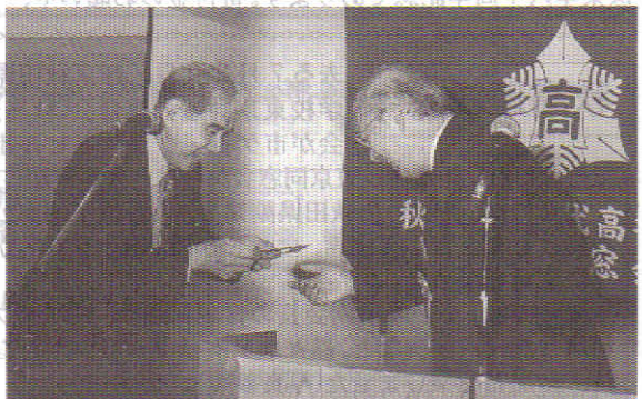
26期 八柳事務局長へ畠会長から記念品贈呈