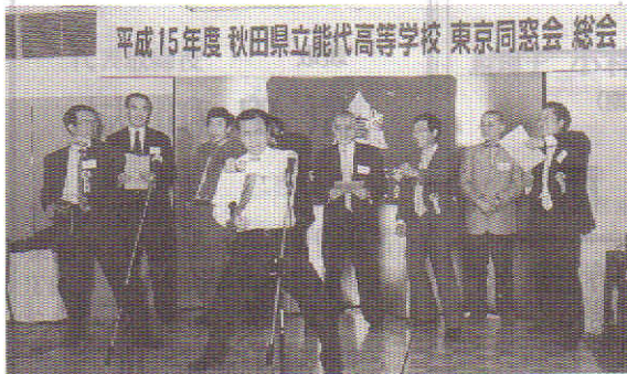
当番幹事 45期 応援歌熱唱